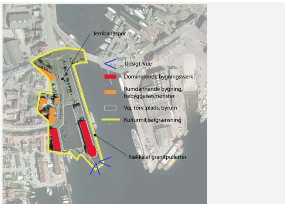
Kulturmiljøets bebyggede struktur er vist på kortet.

Redegørelse: https://kommuneplan.svendborg.dk/hovedstruktur/kulturmiljoe/svendborg-bymidte-og-havn/